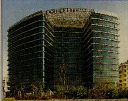
'Doubletree by Hilton', Anadolu yakasının ilk Hilton Worldwide markalı oteli olma özelliği taşıyor. (üstte) 'Doubletree by Hilton'da tamamına yakını deniz manzaralı 247 oda bulunuyor. (altta)

Emrullah Turanlı , 6 otel yatırımına ilişkin şöyle konuştu: "İki tanesi İstanbul Etiler'de. Bir tanesinin inşaatı devam ediyor, bir tanesi Seyrantepe'de. Önümüzdeki ay inşaatı başlayacağız. Gayrettepe'nin inşaatı devam ediyor. Katlı otopark ve otel yatırımı olacak. Ruhsatı bekliyoruz. Ankara'da ve Diyarbakır'da otel projemiz var. 6 projenin toplamı 900 milyon euro. 80 milyon euro'luk kısmını bitirdik."